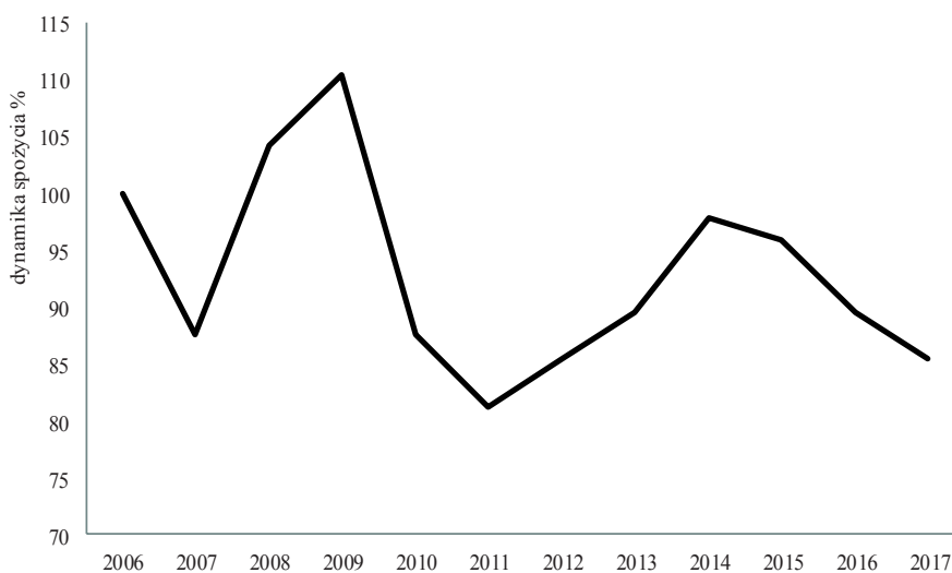
Rys. 3. Indeksy dynamiki spożycia owoców jagodowych w Polsce, w latach 2006-2017