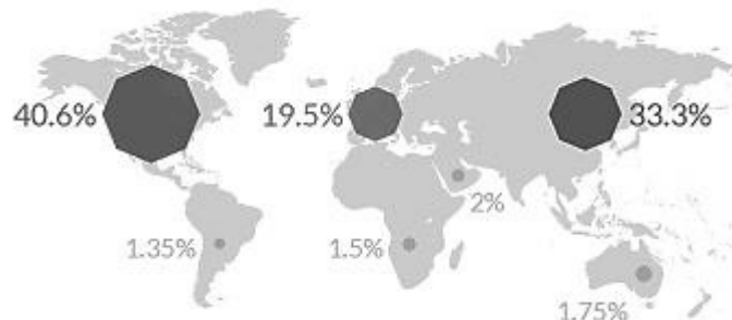
Rys. 2. Wielkość rynków kapitałowych na poszczególnych kontynentach, według wyceny spółek giełdowych