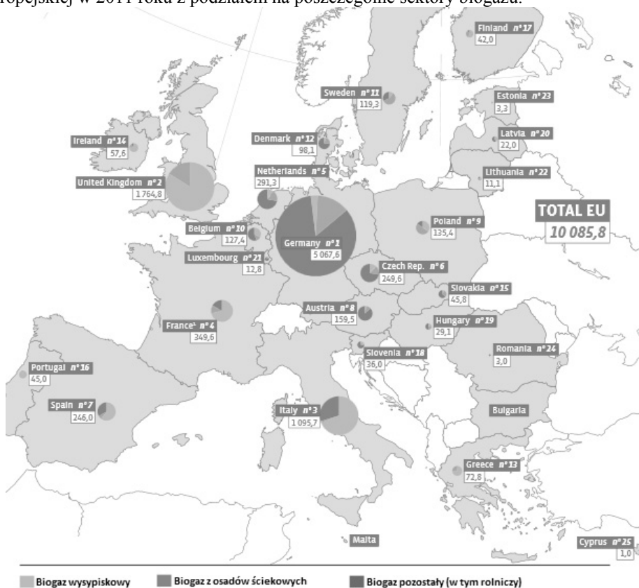
Rys. 2. Produkcja energii z biogazu w Unii Europejskiej w 2011 r.

Według raportu EurObserv'ER najwięcej energii z biogazu w 2010 r. produkowano w Niemczech - 6670 ktoe (toe-tona oleju ekwiwalentnego – jest to energetyczny równoważnik jednej metrycznej tony ropy naftowej o wartości opałowej równej 10.000 kcal/kg.), Wielkiej Brytanii - 1750 ktoe, Włoszech - 507 ktoe, Francji - 334 ktoe, Holandii - 293 ktoe. Polska (114 ktoe) na tle pozostałych krajów Unii Europejskiej. Najmniejszą produkcję energii z gazu z biomasy w 2010 r. odnotowano na Cyprze (1 ktoe), w Rumunii (3 ktoe) i w Estonii (3,7 ktoe). Wielkość produkcji energii pierwotnej z poszczególnych rodzajów produkowanego biogazu porównując 2010 r. i 2011 r. wskazywała na tendencję rosnącą w przypadku Polski, Włoch, Hiszpanii, Szwecji, Grecji, Portugalii, Słowacji i Litwy. Tendencję malejącą w totalnym (całościowym) wyniku produkcyjnym odnotowano w Niemczech, Austrii i Danii [Raport... 2012]. Z kolei w 2009 r. ogółem wyprodukowana bioenergia w UE-27 wynosiła 106,84 TWh, podczas gdy zainstalowana moc wytwórcza wynosiła 25,97 GW (z tego 5,08 GW z biogazu). Przewiduje się, że w następnej dekadzie produkcja energii z biomasy podwoi się [Jaeger-Waldau i in. 2011]. Rysunek 2 obrazuje wielkość produkcji [w ktoe] energii z biogazu w Polsce na tle Unii Europejskiej w 2011 roku z podziałem na poszczególne sektory biogazu.