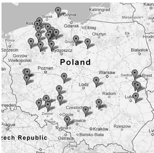
Rys. 3. Biogazownie rolnicze w Polsce w 2013 r.

W Polsce w 2013 r. funkcjonują 32 biogazownie rolnicze (rys. 3), o łącznej wydajności instalacji do produkcji biogazu 130,33 mln m 3 /rok i łącznej mocy układu: energii elektrycznej 36,38 MW e i cieplnej 36,26 MW t . Dla porównania w 2011 r. było ich jedynie 17. Wszystkie zarejestrowane w Polsce przedsiębiorstwa energetyczne zajmują się wytwarzaniem energii elektrycznej z biogazu rolniczego w układzie kogeneracyjnym, pozwalającym wytwarzać i wykorzystywać jednocześnie, w skojarzeniu energię elektryczną i ciepłą.