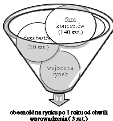
Rys. 2. Efektywność procesu opracowywania oraz wprowadzania nowych produktów w przedsiębiorstwach branży FMCG

Należy pamiętać jednak, że opracowywanie i wprowadzanie nowych oraz rozwój istniejących już produktów jest również ryzykownym przedsięwzięciem dla przedsiębiorstw, nie wszystkie skomercjalizowane produkty odnoszą sukces. Proces opracowywania cechuje niska skuteczność. Szacuje się że na rynku FMCG około 90% konceptów nie przechodzi fazy testów i nigdy nie trafia na rynek (rys. 2).