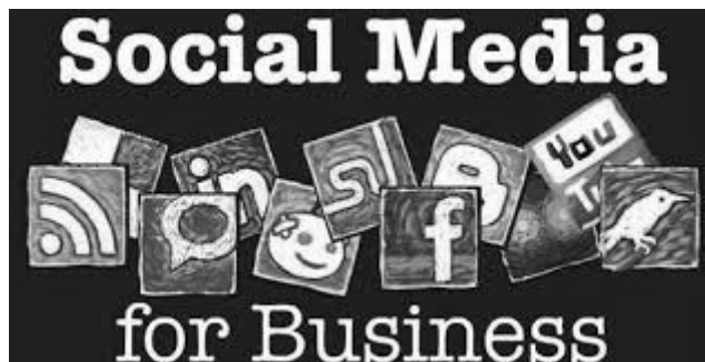
Rys. 2. Media społecznościowe w XXI wieku.

środków przepływu informacji dał możliwość szybszego przepływu informacji gospodarczej (m.in. szybszy kontakt handlowy, szybsze negocjowanie kontraktów), co w latach dziewięćdziesiątych XX wieku przyczyniło się do ogromnego wzrostu inwestycji zagranicznych, bowiem odległość przestała być problemem.