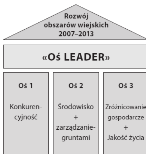
Rys. 2. Program Rozwoju Obszarów Wiejskich i jego osie

związanych z wymaganiami WPR. Spośród narzędzi tej osi, z punktu widzenia poprawy jakości zasobów ludzkich polskiej wsi, szczególnie istotnymi wydawały się działania „Szkolenia zawodowe dla osób zatrudnionych w rolnictwie i leśnictwie” oraz „Korzystanie z usług doradczych”, a także „Renty strukturalne”. Tymczasem, chociaż ich założenia programowe oceniane są jako właściwe [Ocena średniookresowa... 2010], to stan ich wdrażania i praktycznej realizacji uznaje się za niewystarczający. Ma to związek między innymi z późnym uruchomieniem środków na realizację tych narzędzi (jak w przypadku szkoleń zawodowych dla osób zatrudnionych w rolnictwie i leśnictwie), lub z ich niedoszacowaniem (renty strukturalne), ale też z brakiem zainteresowania ze strony beneficjentów (korzystanie z usług doradczych).