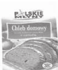
Rys. 3. Znak towarowy, uprawniony POLSKIE MŁYNY S.A., Warszawa, numer prawa ochronnego 220052

Fig. 3. Trademark, authorized POLSKIE MŁYNY S.A., Warsaw, registration number of protection 220052