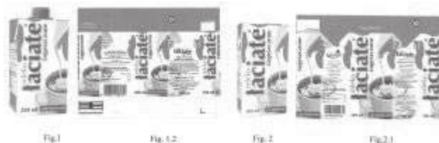
Rys. 2. Wzór przemysłowy, opakowanie mleka, uprawniony Spółdzielnia Mleczarska „MLEKPOL” Grajewo, numer rejestracji 14994